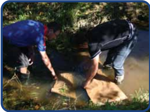
Immergez-les 3~5 minutes dans l'eau

Il n'y a que la partie externe qui est en contact avec l'air. Ainsi, il peut être plusieurs jours au sec avant de perdre de sa masse. Il suffit de l'arroser ou de le plonger dans l'eau pour qu'il reprenne sa masse maximale. Le gel disposé dans un sac hermétique gardera sa consistance indéfiniment.