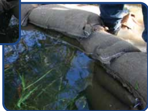
Votre barrière étanche est créée

Une barrière de protection, lourde, flexible et prête à utiliser.