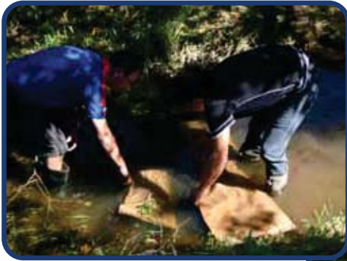
Immergez-les 3~5 minutes dans l'eau

Il n'y a que la partie externe qui est en contact avec l'air. Ainsi, il peut être plusieurs jours au sec avant de perdre de sa masse. Il suffit de l'arroser ou de le plonger dans l'eau pour qu'il reprenne sa masse maximale. Le gel disposé dans un sac hermétique gardera sa consistance indéfiniment.