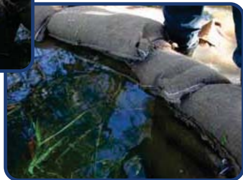
Votre barrière étanche est créée

Une barrière de protection, lourde, flexible et prête à utiliser.